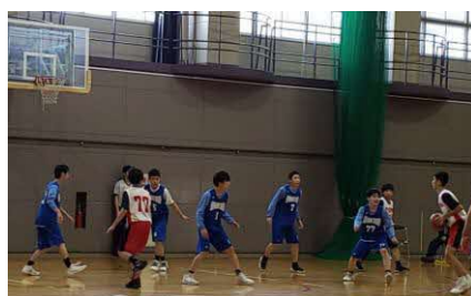
【男子バスケットボール部の試合の様子】