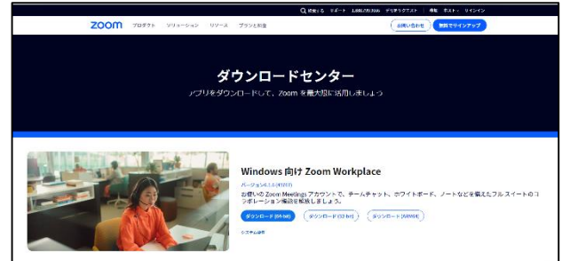
※Windows版のダウンロード画面