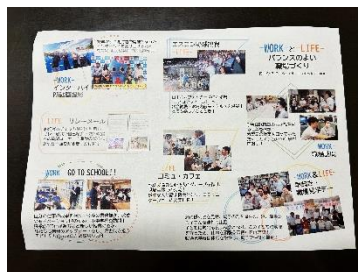
【裏】 Work & Life の 様子