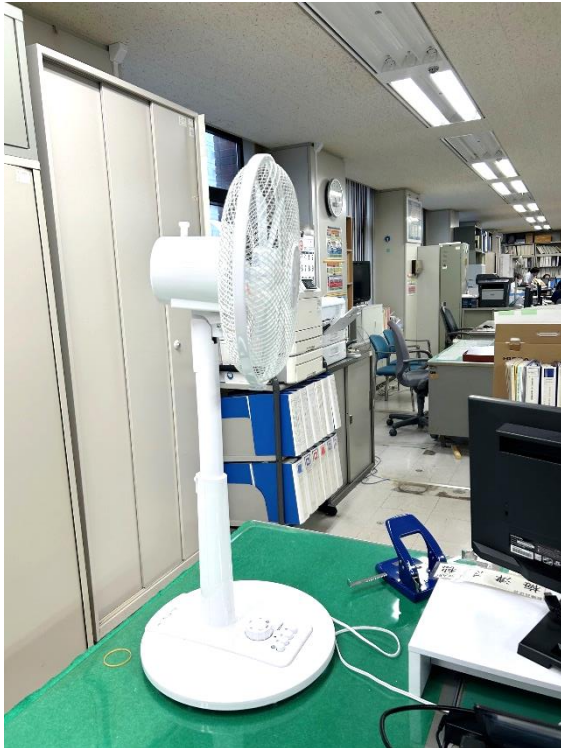
【置き方1】 直接、職員に風を当てるパターン

最近では、かなり気温も落ち着いてきたので、各扇風機は、ようやく役割を終えようとしています。この夏は、本当に助けられました。お疲れ様でした。