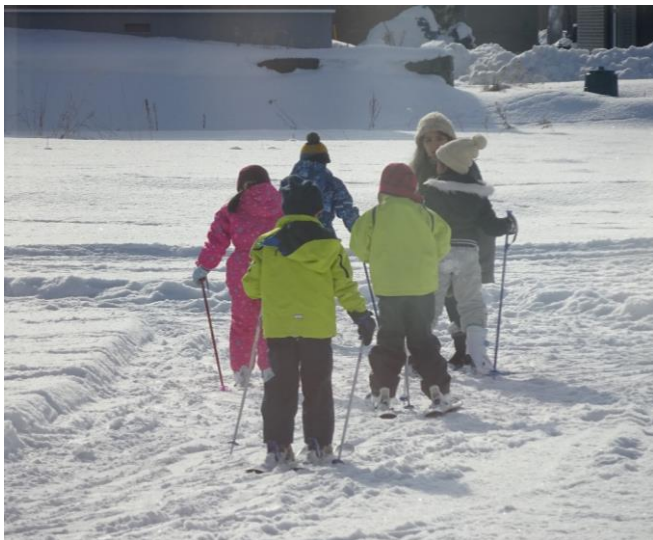
【スキー学習の様子】

冬期間の体力向上に係る取組として、第2学年の体育科の授業において、校庭でスキー学習を行いました。