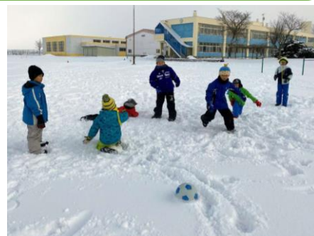
【雪中サッカーの様子】