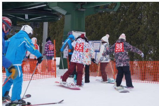
【スキー学習の様子】

保健体育科の授業において、市内のスキー場において全校生徒でスキー学習を行いました。