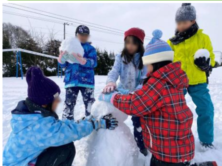
【雪だるまづくりの様子】