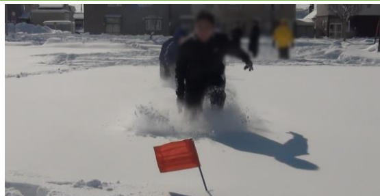
【雪をかき分けてフラッグを取りに行く生徒の様子】