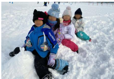
【列車ごっこの様子】

「子ども朝活事業」の一環として、冬期休業中の3日間、1時間程度、屋外で雪上サッカーやそり遊び、雪だるまづくりなど、児童が内容を考え、楽しみながら運動に取り組みました。