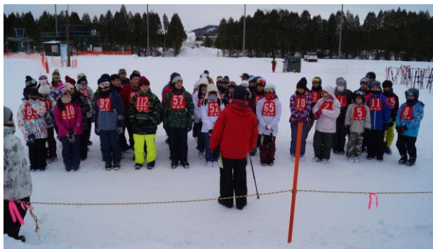
【スキー学習の様子】