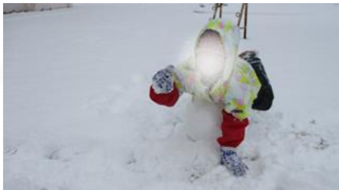
【雪だるまづくりの様子】

雪に親しむ活動として、一人1個の雪だるまを作りました。 雪だるまの大きさや顔などは児童が自由に考えて取り組み、完成した雪だるまを互いに見合うことで、身近な自然を利用して、楽しみながら雪遊びをすることができました。