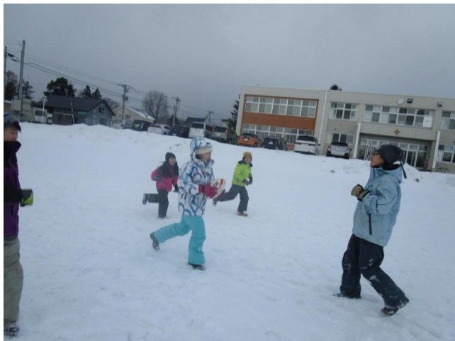
【雪中ラグビーの様子】

冬期間の運動に親しむ取組として、体育科で行っている「タグラグビー」と関連のある運動として、雪中ラグビーを休み時間を活用し、第4学年の児童全員で行いました。