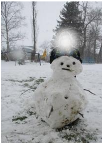
【完成した雪だるま】