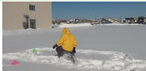
【フットワークの練習を行う生徒の様子】