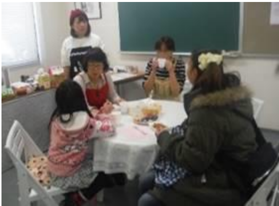
喫茶コーナーで交流する保護者