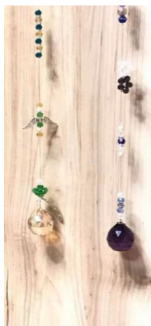
全てが「ハッピー」手作りのイベント 右が完成したサンキャッチャー