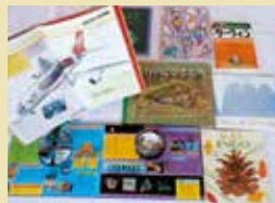
理科読おすすめ本