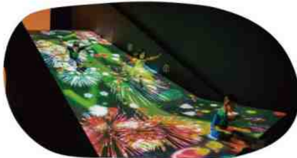
すべて育てる!フルーツ畑

育む力 クリエイティビティ・表現力の発揮、多様性の尊重、自己効力感の醸成、テクノロジーへの興味