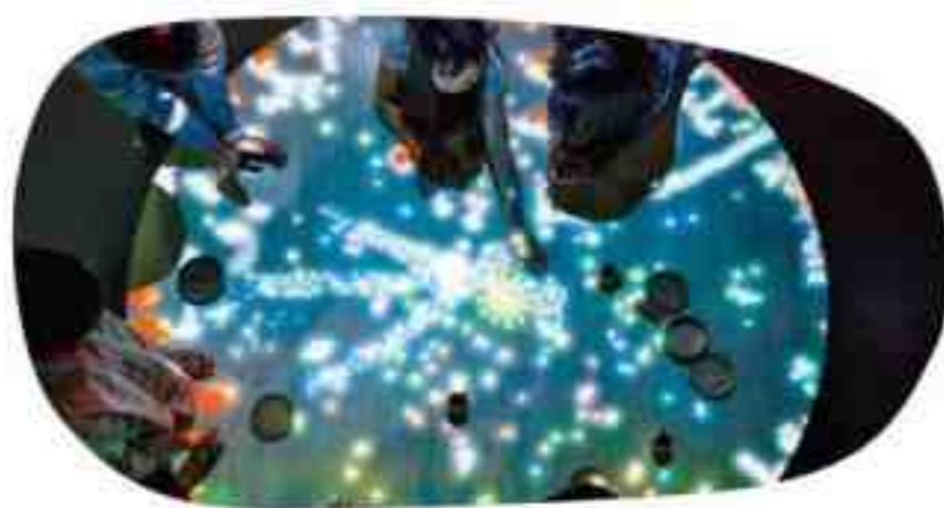
小人が住まうテーブル

育む力 パターン認識力、論理的思考、クリエイティビティ・表現力の発揮、重力という物理法則