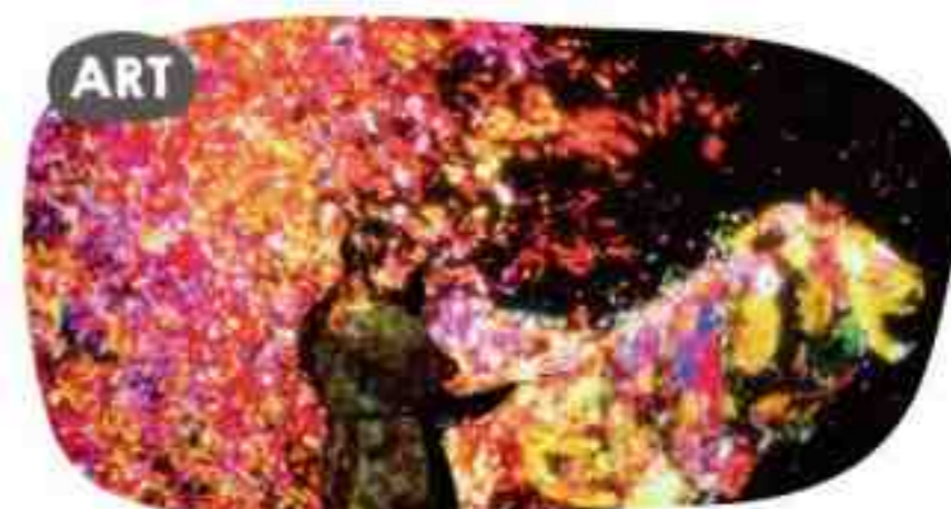
花と共に生きる動物達

育む力 パターン認識力、論理的思考、クリエイティビティ・表現力の発揮、重力という物理法則