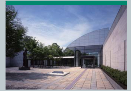
北海道立帯広美術館 郵遞區號080-0846 帯広市緑之丘2番地 緑之丘公園