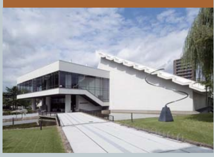
北海道立近代美術館 郵遞區號060-0001 札幌市中央区北1條西17丁目