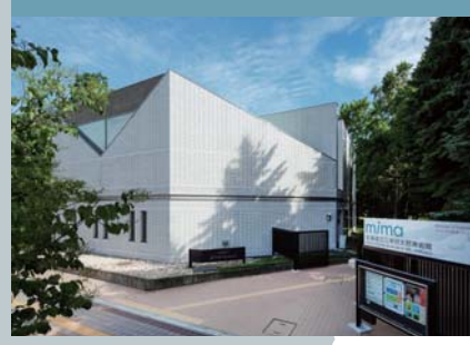
mima 北海道立三岸好太郎美術館 郵遞區號060-0002 札幌市中央区北2條西15丁目