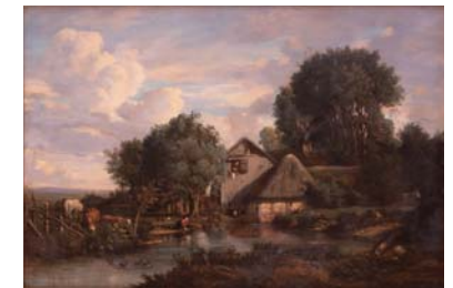
朱爾·迪普雷《貝里地方的農家》 1830年代