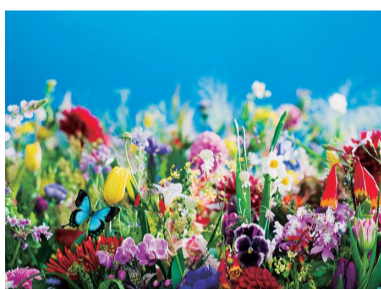
蜷川実花《earthly flowers, heavenly colors》2017年

色彩に富んだ鮮烈な作品で知られ、数々の活動を展開する写真家・蜷川実花。本展では“虚構と現実”をテーマに、時代をとらえる蜷川実花の作品世界に迫ります。