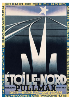
カッサンドル(アドルフ・ジャン・ムーロン) 《北極星号—フランス北部鉄道》1927年 ©MOURON, CASSANDRE. All rights reserved/ JASPAR 2020 G2137

作家たちの画業の初期に焦点を当てます。自身の表現への模索が見られるもの、画業の初期に生涯の作風を確立させた作品などを通じて、作家たちの若い日の様々な挑戦を紹介します。