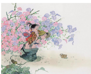
中島潔《うし蛙》(部分) 2012年 ©中島潔

繊細な描写と生命の流れを思わせる表現から、「風の画家」とも呼ばれる中島潔(1943-)。生命の輝きを鮮やかに表現する作家の世界を紹介します。