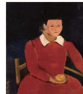
Мигиси Котаро "Девочка с лимоном" 1923 год

На картине изображено тело человека с головой кота трехцветной окраски. Аккуратный стоячий воротник, на ногах ботфорты, и скрещенные руки - это проявление уверенности, или притворства? Популярная картина Мигиси Котаро с богатой фантазией.