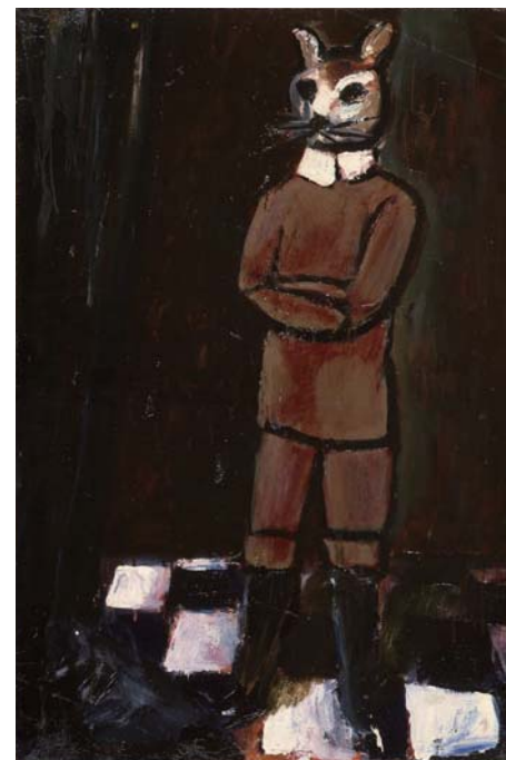
Мигиси Котаро "Кот" 1931 год

Специальная выставка, которая подробно ознакомит посетителей с искусством Мигиси Котаро, и притягивает коллекции музеев и художников.