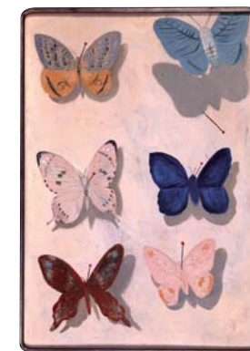
Мигиси Котаро "Летающая бабочка" 1934 год