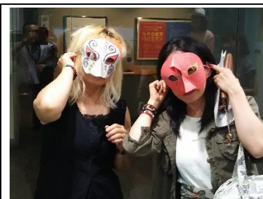
大人の参加者による作例