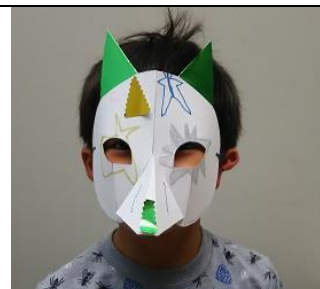
参加者による作例