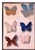
三岸好太郎 《飛ぶ蝶》 1934年