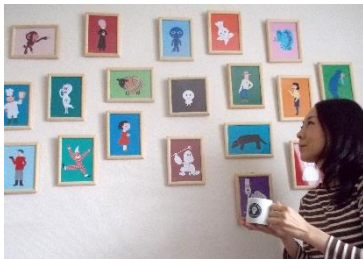
なかいけいさんとマ〜ルシリーズのお友だち。

どのプログラムも ★小学生は無料 ★保護者は要観覧料（一般510円。65歳以上は無料）