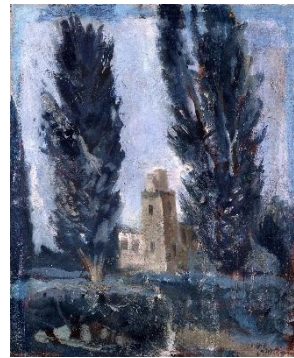
三岸好太郎《北大のポプラ並木》