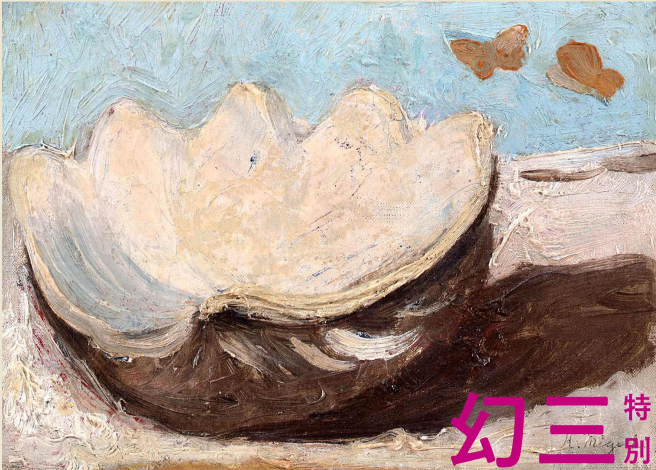
三岸好太郎《貝殻と蝶》1934年 当館蔵