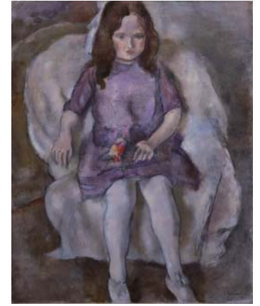
줄-파스킨 《꽃다발을 든 소녀》 1925-26년

아르누보의 기수 에밀 갈레의 명작. 갈레 본인이 이를 붙인 Moonlight Glass를 흐르는 물에 떠있는 커다란 잉어처럼 보이게 만들었습니다. 잉어의 모양은 호쿠사이의 우키요에에서 인용한 문외불출의 작품. 이곳에서만 볼 수 있습니다.