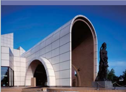
홋카이도립 하코다테 미술관