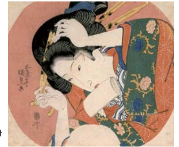
우타가와 쿠니사다 《비녀》 19세기