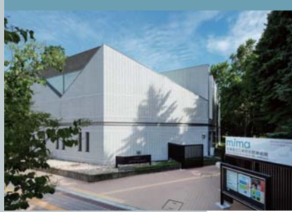
mima 홋카이도립 미가시 고타로 미술관