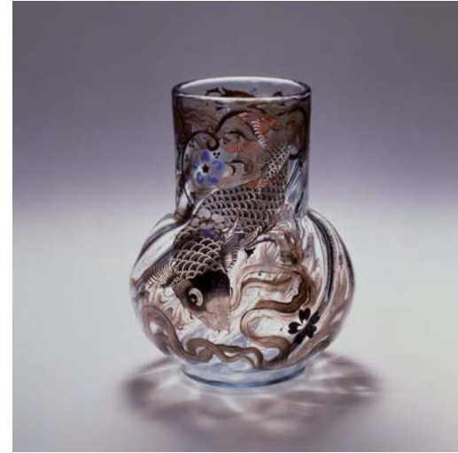
에밀 갈레 《잉어 꽃병》 1878년경

국내외의 훌륭한 작품들에 의한 다양한 시대와 장르의 전람회를 전시실B에서 개최하고 있습니다.