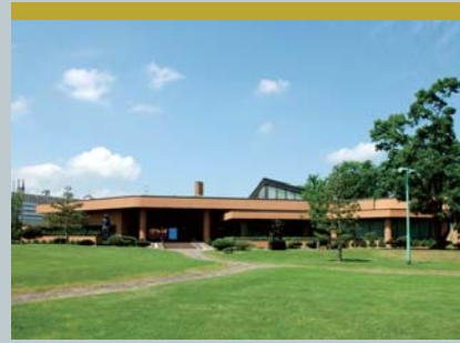
홋카이도립 아사히카와 미술관