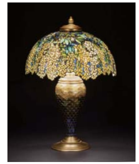
루이·컴포트·티파니 《램프·금사슬나무》 1900 - 10년