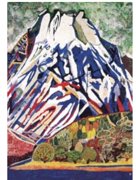
가타오카다마코 《후지산》 1967년