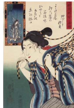
우타가와쿠니요시 《다이간쥬쥬아리가타키지마 다마다레노다키》 19세기

국내외의 훌륭한 작품에 의한 다양한 시대와 장르의 전람회를 전시실B에서 개최하고 있습니다.