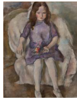
줄·파스킨 《꽃다발을 든 소녀》 1925 - 26년