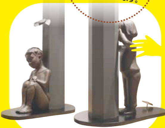
椎名澄子《風の子》2014年 作家蔵 SHIINA Sumiko (Kaze no Ko) 2014

ふれるかたち Touching Sculpture 彫刻や立体作品に手でふれ、 かたちや質感を 感じていただきます。