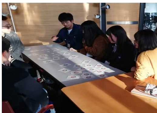
【グループワークの様子】