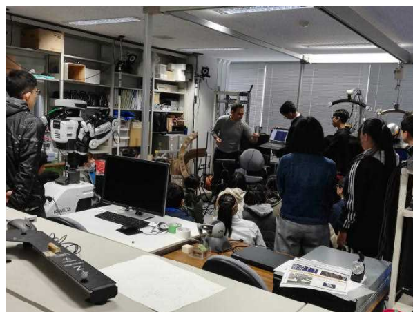
【研究室紹介の様子】

参加生徒からは、「海外の大学で学ぶ意欲が確実なものとなった」などの意見があり、英語の専門用語は難しかったようですが、大変、有意義な時間となりました。