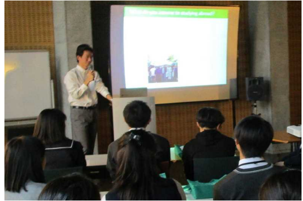
【立岩さんによるプレゼンの様子】

参加生徒からは、「留学する際、何を目的にして行ったら良いか分かった」、「何事も粘り強く取り組むことが大切だと学んだ」といった感想がありました。