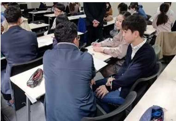
【留学生との交流の様子】

次に、外国人留学生が日本語を学ぶ授業に参加しました。参加生徒は留学生とお互いに自己紹介をして交流するほか、外国語としての日本語を学びました。