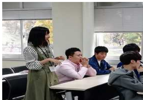
【参加生徒によるプレゼンの様子】

参加生徒からは、「高校生と大学生の視点の違い、互いの価値観、留学生などの他文化の考えを交流できて面白かった」、「世界中の人々の価値観の違いに改めて気づかされたとともに、価値観の違いにより生じる問題を考えるいいきっかけとなった」といった感想がありました。