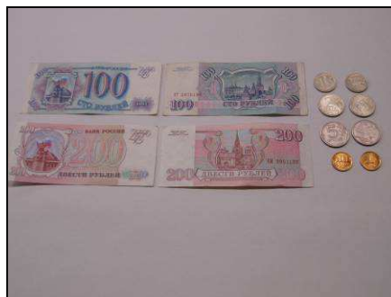
モスクワの主な品目の価格

ロシアの物価は、インフレにより変動が激しいところですが、次のとおりモスクワの主な品目の価格を参考までに示してみます。