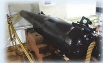
↑ 船内には、実際に使用された大砲や砲弾が展示されている。

開陽丸は箱館戦争の最中である1868年に座礁し、旧幕府軍が見守るなか江差の海中で眠りについた。昭和50年から船の引き揚げ事業が開始され、平成2年に再建、122年ぶりにその勇姿を私たちの前に見せた。館内では引揚品展示や砲弾の模擬発射体験ができる。