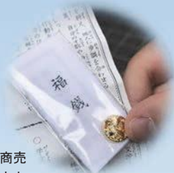
福銭は金運、商売運を呼び込むと人気の授与品。