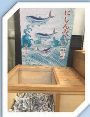
ご当地おみくじである「にしんみくじ」。御利益も群来並みに期待？

町民から崇められていた予言者であった「折居様」が授かったお告げによりニシン豊漁が始まった。その折居様が祈りを捧げていた神像を祀ったのが姥神大神宮の起源とされ、五百有余年の歴史を持つ北海道最古の神社と呼ばれる。