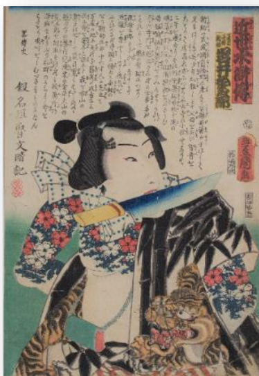
歌川国貞(三代豊国) 〈近世水滸伝 夏目子僧新助 岩井桑三郎〉 1861年 河村泳静氏蔵/伊達市教育委員会寄託

GHQの印刷・出版担当として1945年来日し、12年間日本暮らししたシャーマン。日本美術を愛好した彼が魅せられ、収集した歌川国貞(三代豊国)や歌川国芳などの浮世絵25点を展覧します。