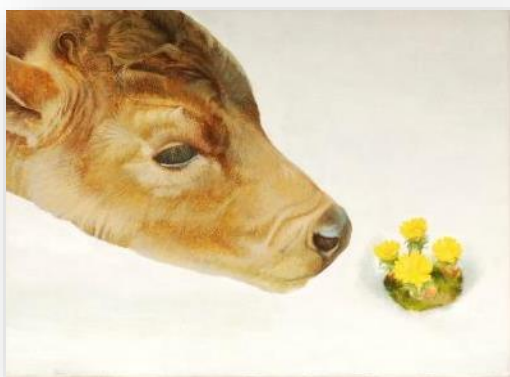
海月清則〈こうしがうまれたよ〉1988年 剣淵町絵本の館蔵

世界の絵本原画がやってきた! 剣淵町絵本の館コレクション 2019 4.18 ▶ 6.9 会場：北海道立函館美術館