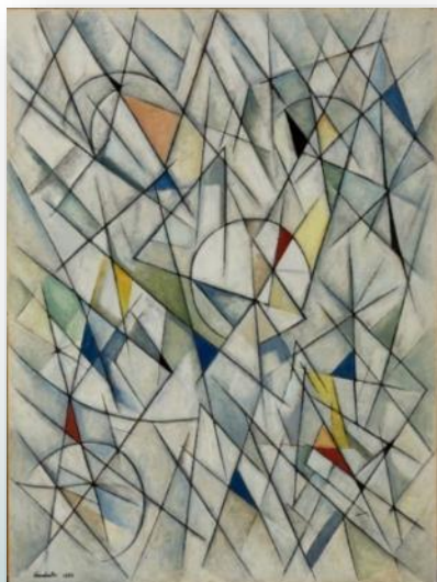
難波田龍起〈軌跡〉 1956年 道立近代美術館蔵

2020年に生誕115年を迎える、日本画の片岡球子(1905-2008)と、抽象絵画の難波田龍起(1905-1997)。ともに北海道に生まれ、昭和から平成にかけてそれぞれの絵画世界を深め、近代日本美術史に大きな足跡を残しました。代表作など約50点を展示します。