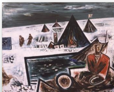
居串佳一〈氷上漁業〉1936年 網走市立美術館蔵

網走市立美術館コレクション選 居串佳一とオホーツクの画家たち 2019 12.14 ▶ 2020 3.15 会場：北海道立帯広美術館