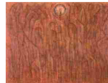
難波田龍起《生的交響詩》 1992年