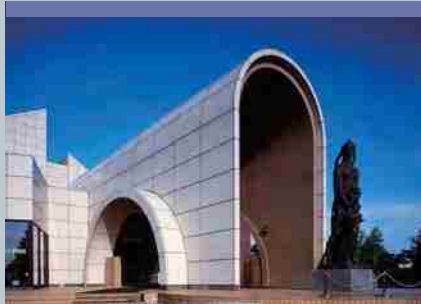
北海道立函館美術館