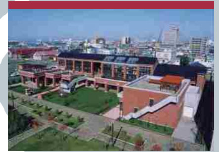
北海道立釧路藝術館