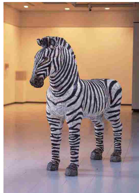
三澤厚彦 《動物 2000-02》 2000年