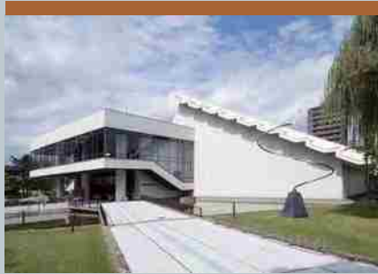
北海道立近代美術館