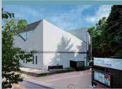
mima 北海道立三岸好太郎美術館