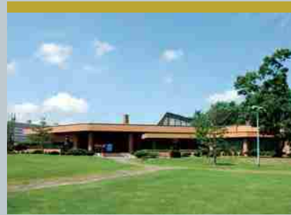
北海道立旭川美術館