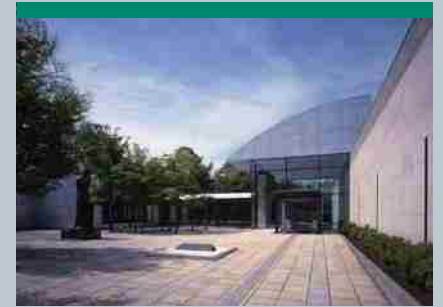
北海道立帯広美術館