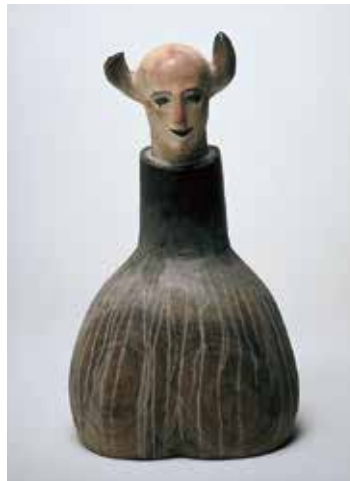
舟越桂〈夜は夜に〉2003年