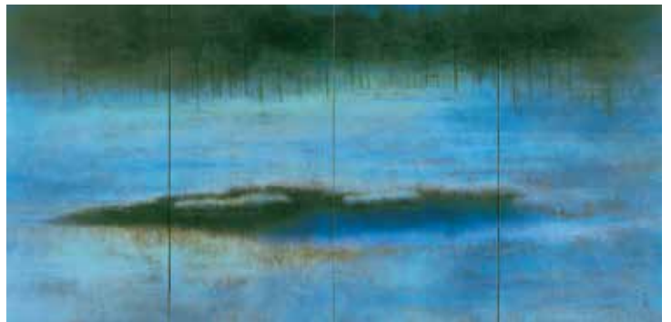
福井爽人〈沼の風景〉2002年