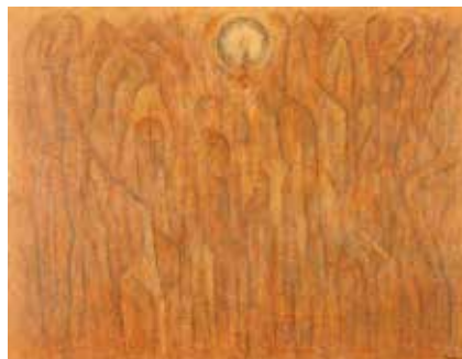
難波田龍起〈生の交響詩〉1992年