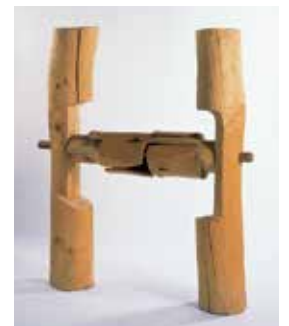
砂澤ビッキ〈集吸呼A〉1986年