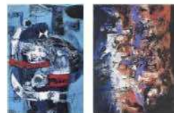
砂澤ビッキ〈北の王〉〈北の王妃〉1987年

「木」をキーワードに自然と美術の関わりを探ります。道北の首威子府で制作された砂澤ビッキのダイナミックな代表作も紹介。