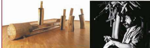
砂澤ビッキ〈風に聴く〉1986年 札幌芸術の森美術館蔵