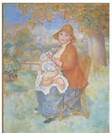
オーギュスト・ロダン 〈母子像(アリスと息子ピエール)〉 1886年

ダヴィッド、ドラクロワを代表とする19世紀のアカデミズム絵画からモディリアーニ、フジタ(藤田嗣治)ら20世紀初めのエコール・ド・パリまで、フランス近代絵画の精華をラリックの幻想的なガラスとともに紹介。