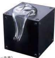
鹿目尚志〈迷いの全て-失楽園〉 1981年 当館蔵

絵本原画から現代美術まで、クイズを解きながら幅広いアートと対話する展覧会です。子どもから大人まで楽しく鑑賞できます。