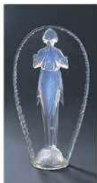
ルネ・ラリック 〈立像「音楽者」〉 1919年

観覧料 | 一般1200(1000)円 高大生700(500)円 中学生400(300)円 小学生以下無料(要保護者同伴)