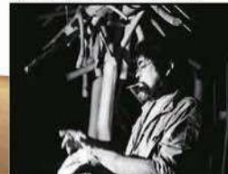
アトリエの砂澤ビッキ

観覧料 | 一般800(600)円 高大生500(400)円 小中生300(200)円