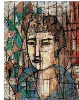
難波田龍起〈初夏の粧い〉1953年