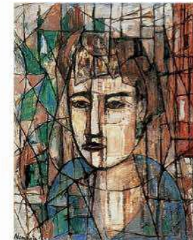
難波田龍起〈初夏の粧い〉1953年