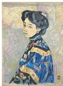
藤島武二〈婦人像〉1927年頃

日本の近現代絵画から梅原龍三郎や竹久夢二、東郷青児、藤井勉などの多彩な女性像を集め、「フォルム」「現実」「夢」に焦点をあてて紹介。女性と絵画をめぐる近代以降のまなざしを探ります。