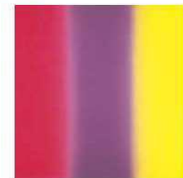
百瀬寿 〈Square-between Pink and Yellow〉 1981年

具象的なイメージから放たれ、色と形が織りなす自由で多彩な表現によって生み出された絵画や彫刻を紹介。それぞれ作品からにじむ「ココロ」を感じてください。