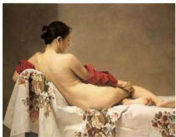
森本草介〈微睡の時〉1984年 いずれも笠間日動美術館蔵