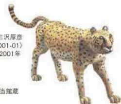
小野州一 〈丘の風塵〉 1997年 いずれも当館蔵

観覧料 | 一般510(400)円 高大生300(250)円 中学生以下、65歳以上無料