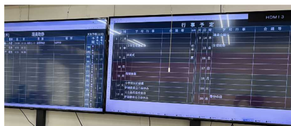
【Google スプレッドシートを用いた情報の一元化】