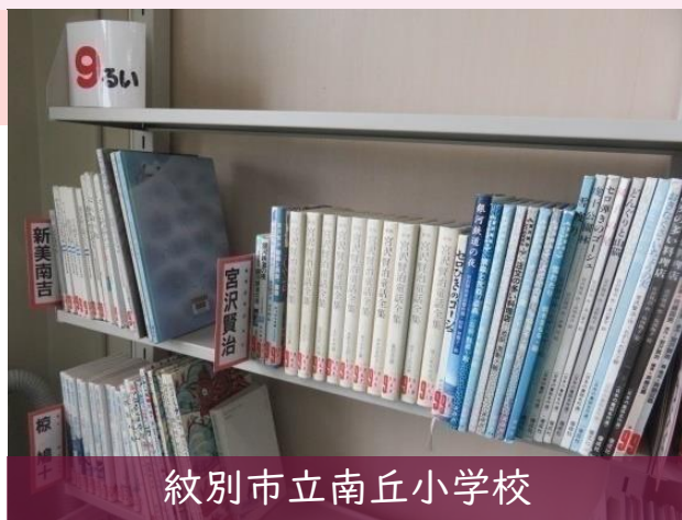
紋別市立南丘小学校

授業で読んだ物語の作者の他の作品を紹介することにより、お気に入りの作者の本を読もうとするなど、子どもたちの読書意欲を高め、日常生活における読書活動につながるよう工夫しています。