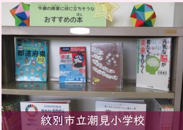
紋別市立潮見小学校