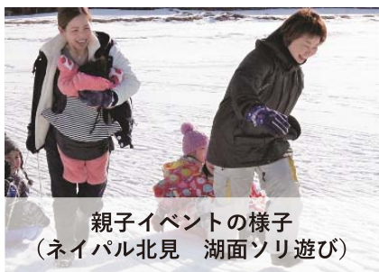
親子イベントの様子 (ネイパル北見 湖面ソリ遊び)

道内6か所にある道立青少年体験活動支援施設ネイパルは、学校の宿泊研修などの受入れだけでなく、年間を通じて様々なイベントを開催しています。子どもだけで参加するイベントのほか、 家族を対象としたイベント も予定しています。野外活動など様々な体験活動に親子で挑戦するプログラムや、 保護者同士が子育ての悩みなどを気軽に共有できるプログラム などをおして、子どもの更なる成長や家族の絆をより強める機会にはいかがでしょうか。