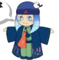
大会イメージキャラクター 「ピリカ」