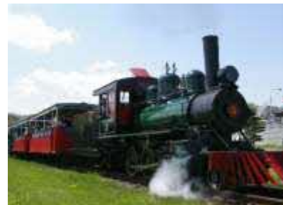
「SL アイアンホース号」