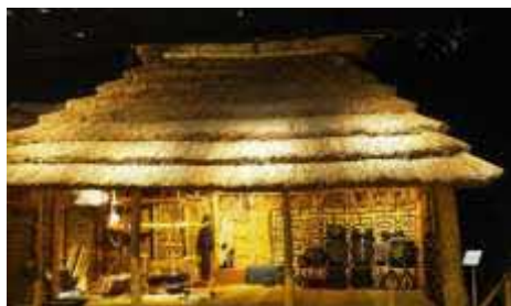
「アイヌ文化の世界」