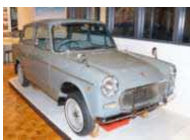
「わたしたちの時代へ」