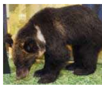
「生き物たちの北海道」