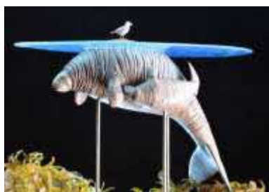
「北海道 120 万年物語」

自然環境と人とのかわりや、アイヌ民族の文化、本州から渡ってきた移住者の暮らしなど、北海道の自然・歴史・文化の展示を行っている北海道博物館では、5つのテーマからなる展示をオンラインで公開しています。