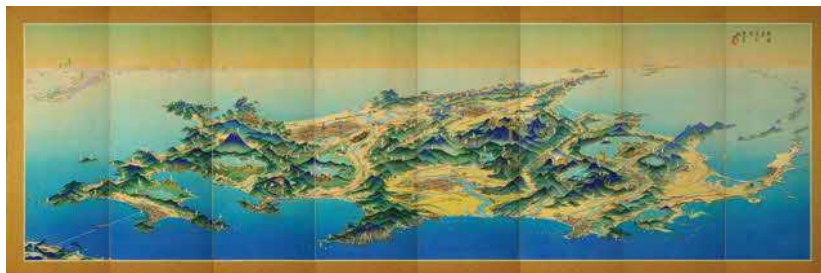
「北海道らしさの秘密」