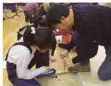
こども考古学教室「火おこし体験」