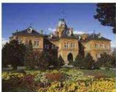
国指定重要文化財「北海道庁旧本庁舎」