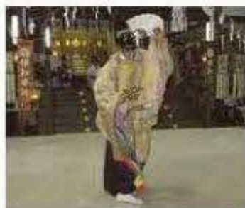
国指定重要無形民俗文化財「松前神楽」