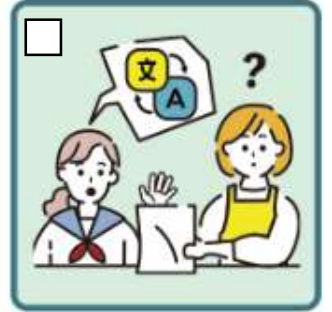
日本語が第一言語ではない家族や障がいのある家族のために通訳をしている