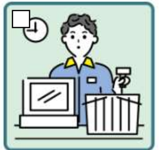
家計を支えるために労働をして、障がいや病気のある家族を助けている