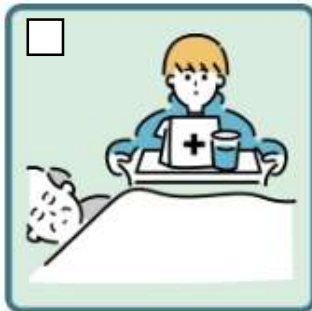
がん・難病・精神疾患など慢性的な病気の家族の看病をしている