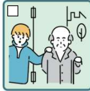
目を離せない家族の見守りや声かけなどの気づかいをしている